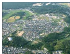
・岡垣ふる里どんぐり村 ・キッズパークタウンDONGURI