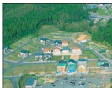
・宗像キッズパーク桜