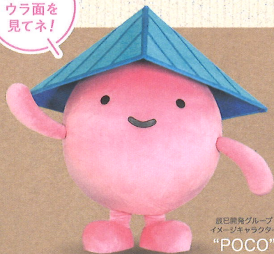
辰巳開発グループ イメージキャラクター "POCO"