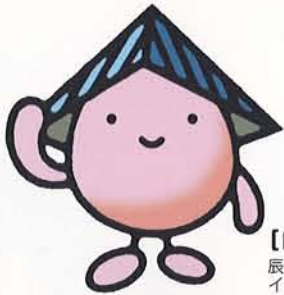
ポコ 【POCO】 辰巳開発グループ イメージキャラクター