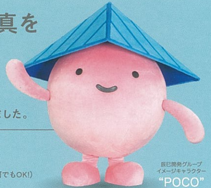
辰巳開発グループ イメージキャラクター “POCO”