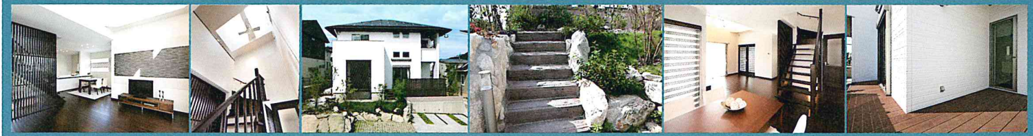
エコノ外観・室内写真 / 平成23年10月3日撮影